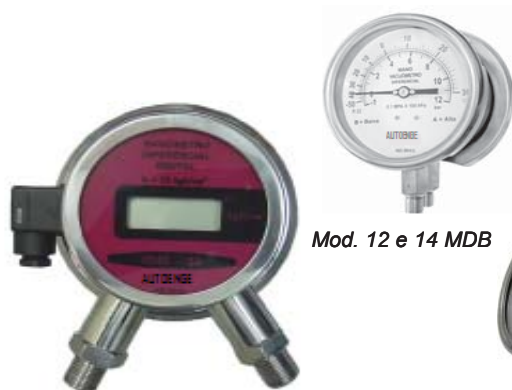
Mod. 10, 12 e 14 MDE