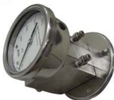
Mod. 12 e 14 MDF